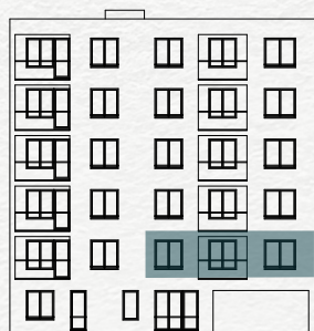
Položaj stana na fasadi